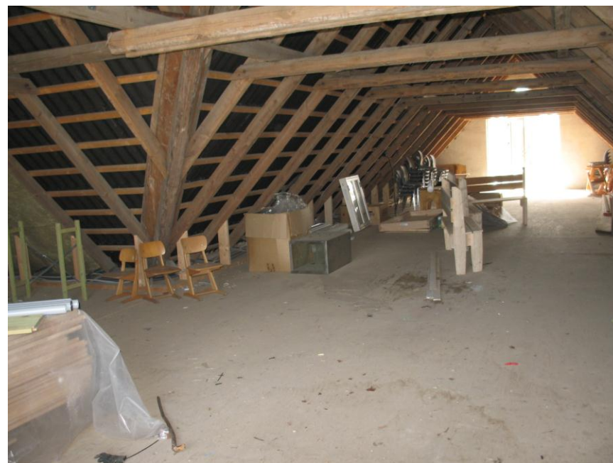
1. salen der skal istandsættes

Informationsfolder, der forklarer det lidt nærmere!